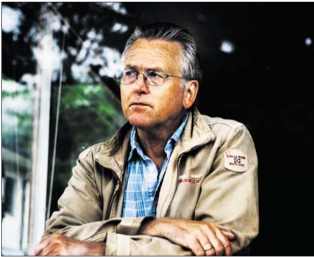
Gunnar Staalesen har skabt det norske svar på Philip Marlowe, som denne gang er i en alvorlig knibe.